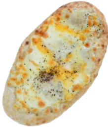
クワトロ フォルマッジ 750 yen