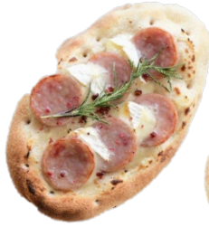
ソーセージと モッツアレラ 750 yen