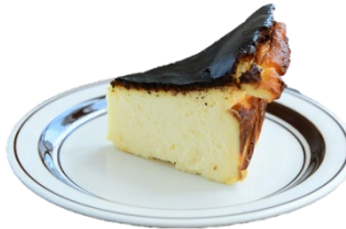
バスク チーズケーキ 600 yen