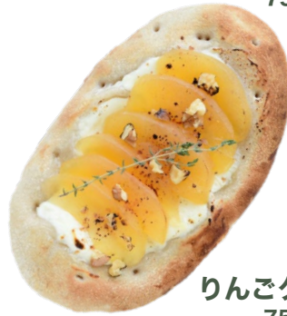
りんごクリチ 750 yen