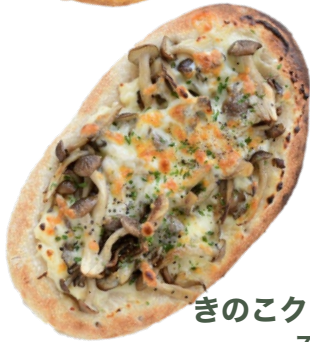
きのこクリーム 750 yen