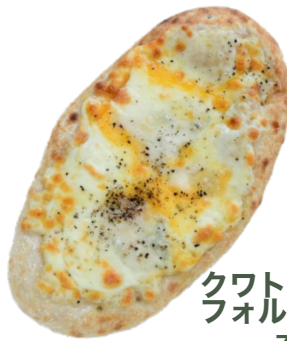
クワトロ フォルマッジ 750 yen