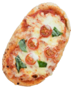
Margherita 750 yen