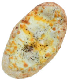
Quattro Formaggi 750 yen