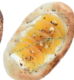
Apple & Cream cheese 750 yen