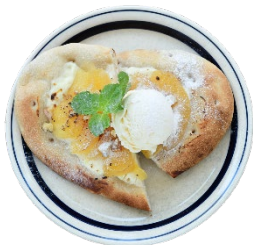
Apple & Cream cheese