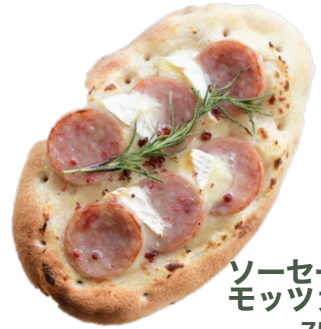
ソーセージと モッツァレラ 750 yen