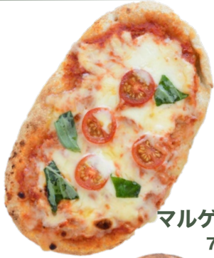
マルゲリータ 750 yen