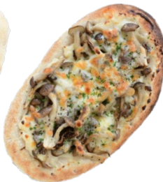
Mushroom 750 yen