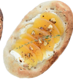
りんごクリチ 750 yen