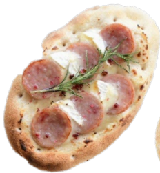
Sausage & Mozzarella 750 yen