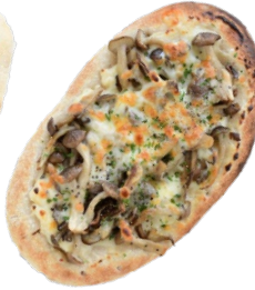
きのこクリーム 750 yen